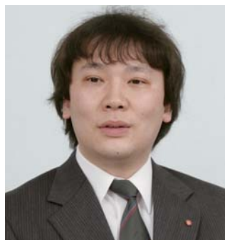
株式会社ライフランド 情報システム室 主事